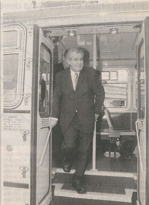
TO BYLA JÍZDA! Miloš Zeman se ve Spojených státech svezl českým trolejbusem ze Škody Ostrov. Pochválil přítomné Američany, že si vybrali dobře. MF IVEB 8. 11. 2001